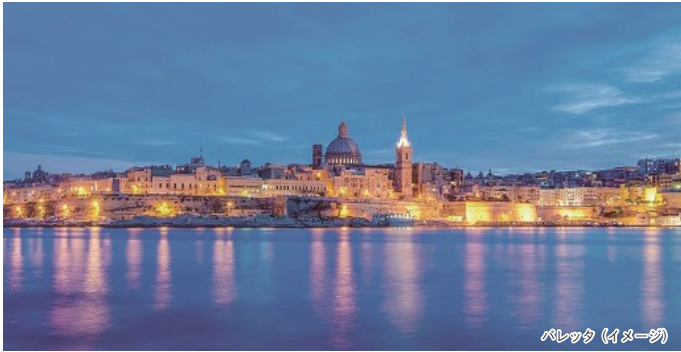
ヴァレッタ (イメージ)

(1月以降のご出発はお問い合わせください) レッスン数の変更や料金表に記載の週数以上も手配可能です。詳しくはお問い合わせください。