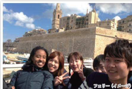
ファミリー (イメージ)

英語力を証明する資格は必要ありません。一般的な目安として、日常的な英会話力と、自己アピールを含め英語での簡単な面接が出来る方でしたら、どなたでもご参加いただけます。また英語力がご心配な方は、事前の英語研修をより多く受けていただくことをおすすめします。ご興味がありましたら、お気軽に ISS までご相談ください。