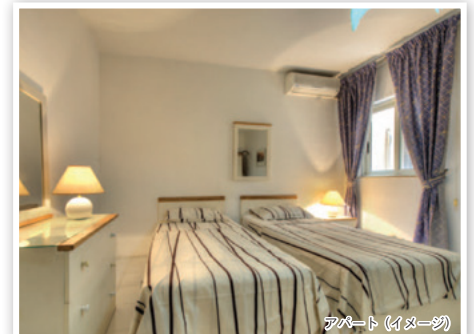
アパート (イメージ)