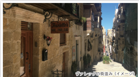
ヴァレッタの街並み (イメージ)