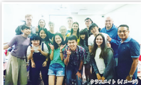
クラスメイト (イメージ)