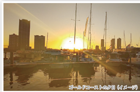
ゴールドコーストの夕日 (イメージ)