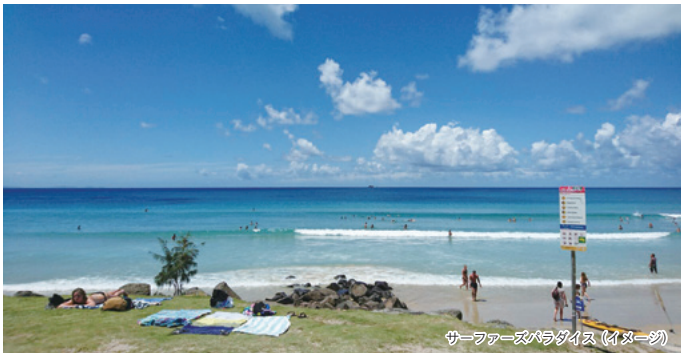
サーファーズパラダイス (イメージ)

(1月以降のご出発はお問い合わせください) レッスン数の変更や料金表に記載の週数以上も手配可能です。詳しくはお問い合わせください。