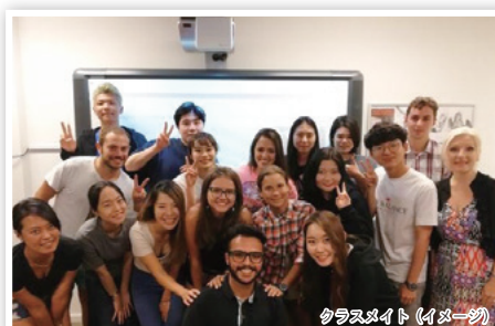
クラスメイト (イメージ)