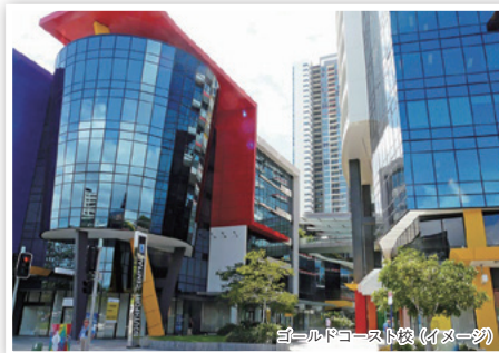
ゴールドコースト校 (イメージ)