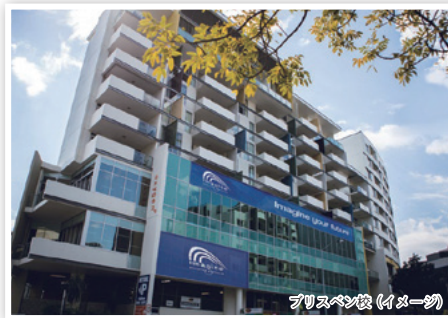
ブリスベン校 (イメージ)