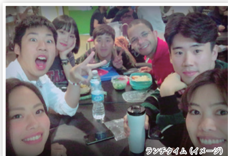
ランチタイム (イメージ)