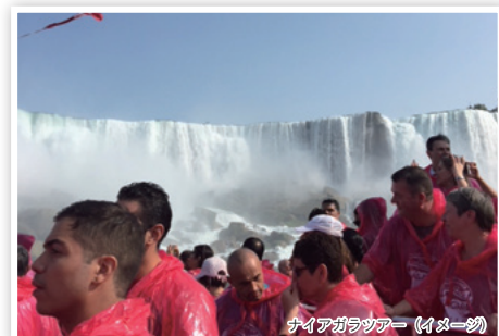
ハイアガラツアー (イメージ)