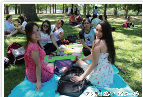
アクティビティ (イメージ)