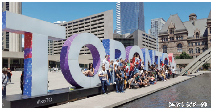
トロント (イメージ)