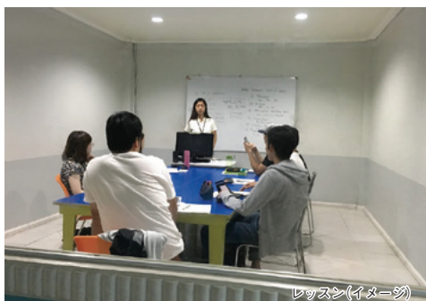
レッスン(イメージ)