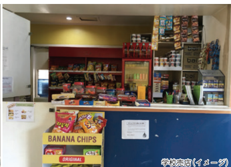
学校売店(イメージ)