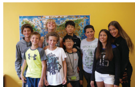
クラスのみならず