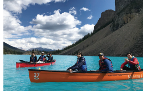
ロッキーツアーではこんな自然が広がります

※ 7月の英語クラスは 14才 ~ 18才で編成されますが、8月以降は 14才以上で編成されます。