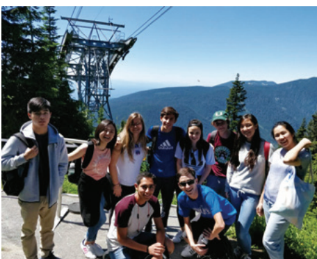
アクティビティーでカナダを満喫!