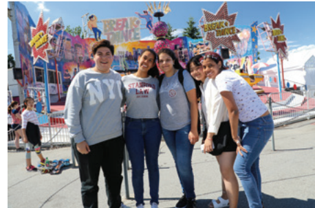
たくさんの友人ができました!