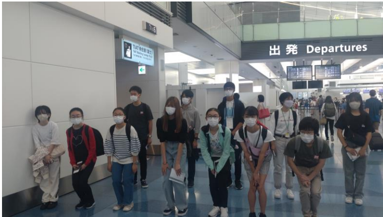
添乗員と集合し、みんなで飛行機に乗ってロンドンまで向かいます！