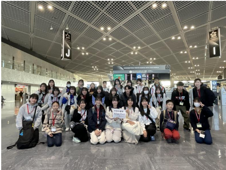
添乗員と集合し、みんなで飛行機に乗ってロサンゼルスまで向かいます！