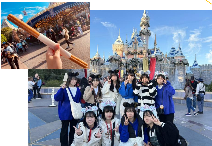
土曜日はカリフォルニアディズニーランドへの1日エクスカーション。おなじみの耳を付けたりチュロスを食べたり、思う存分楽しんで下さい。