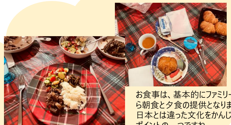
お食事は、基本的にファミリーから朝食と夕食の提供となります。日本とは違った文化をかんじるポイントの一つですね。