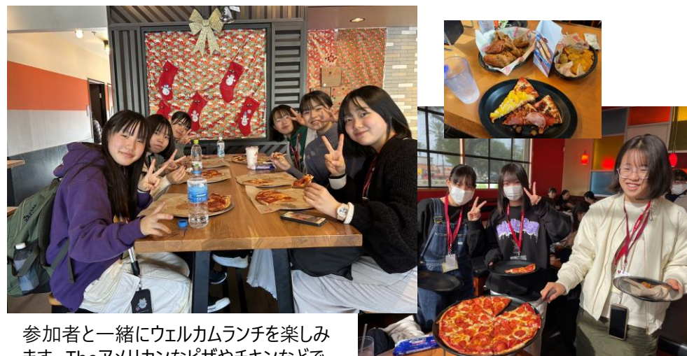
参加者と一緒にウェルカムランチを楽しみます。Theアメリカンなピザやチキンなどで交流を深めましょう。