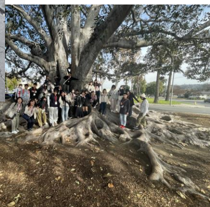
滞在期間中のアクティビティは、ダウンタウンやハリウッドの観光や、動物園や博物館など、盛沢山。ロサンゼルスを満喫しましょう。