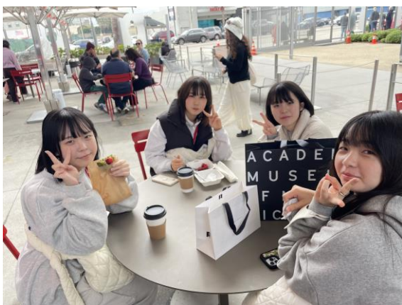
昼食はみんなでランチを購入して食べます。アメリカドルの使い方や、クレジットカードの使い方などを準備しておくとう安心ですね。