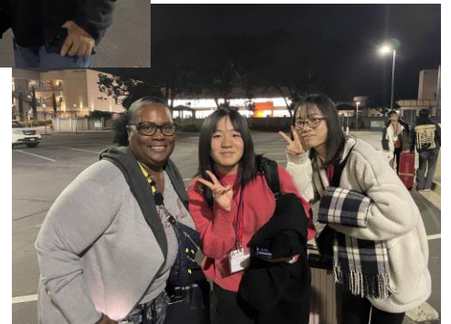
約10時間半のフライトを終え、ロサンゼルスに到着。2週間を一緒に過ごすホストファミリーとのファーストミートです。自己紹介の仕方や、ハウスルールの確認方法を準備しておくとう安心ですね。