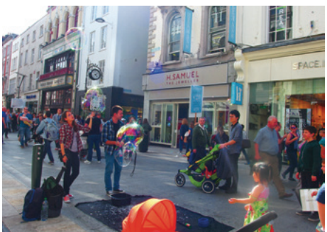
にぎやかなブラフストリート