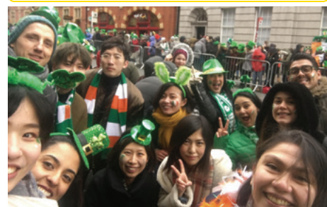
街中がお祭り騒ぎ！セントパトリックデー