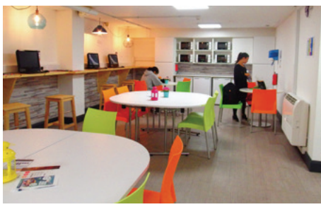
テンプレバー校のラウンジ

マンツーマンレッスンが週1回無料！ 受付で申し込む必要があります。先生と時間を調整し予約をします。(木曜日にすることが多いです。)